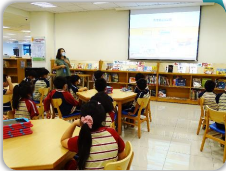
介紹圖書館系統及使用方法。

引導四年級小朋友 查詢圖書館館藏目錄 ，並結合 資訊檢索 的方法，培養查找特定作者或特定主題書籍的能力。