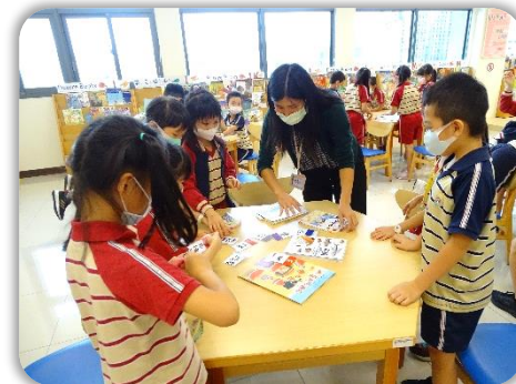
是不是都分類正確呢？