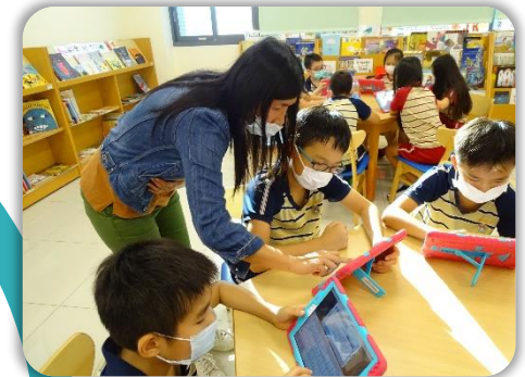
也可以查看電子書喔！

引導四年級小朋友 查詢圖書館館藏目錄 ，並結合 資訊檢索 的方法，培養查找特定作者或特定主題書籍的能力。