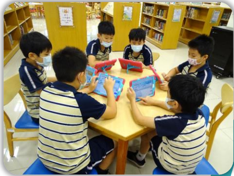
利用ipad實作登入檢索。