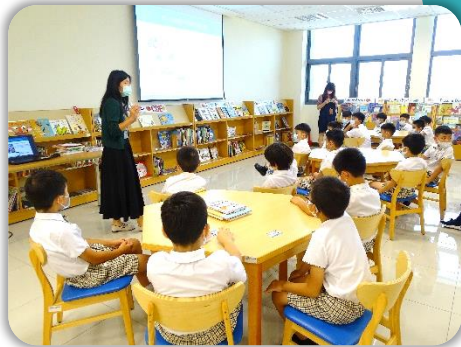
介紹圖書館的圖書分類。

三年級課程讓孩子們認識故事類 書籍的分類方式 與非故事類書籍的十大分類內容，並教導小朋友如何看懂分類號，並 依據分類號從架上找書 ，也可以從分類號簡單分辨出書的主題內容。