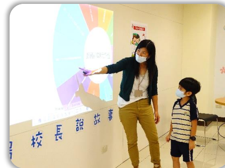
圖書館OX大輪盤！你答對了嗎？

先為孩子們講述《莉莉的第一張借書證》、《狐狸愛上圖書館》兩本繪本，介紹圖書館的功能及培養借閱的觀念。