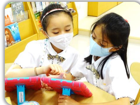
孩子們互相學習討論。