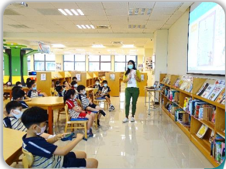
開始介紹書的外表、內部結構，以及圖書的功能。