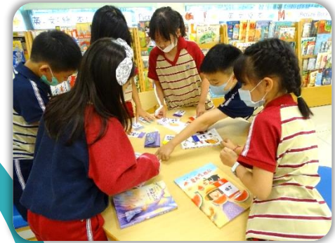
小組練習幫圖書分類。

三年級課程讓孩子們認識故事類 書籍的分類方式 與非故事類書籍的十大分類內容，並教導小朋友如何看懂分類號，並 依據分類號從架上找書 ，也可以從分類號簡單分辨出書的主題內容。