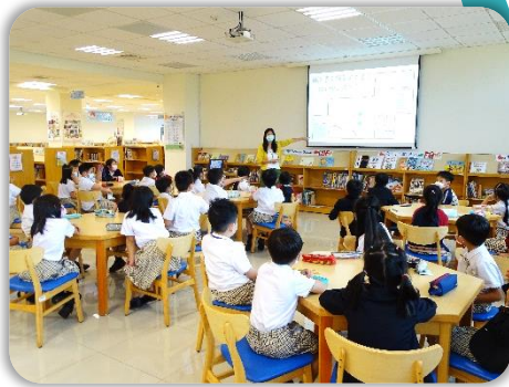
先複習圖書館的規則。

二年級課程利用小組遊戲進行比賽，讓小朋友能實際找出手邊書的各個結構、了解書的功能。