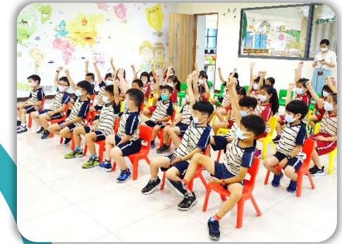
孩子們認真聆聽且踴躍回答問題。

一年級圖書館利用課程以繪本故事引導，讓孩子自然學習認識圖書館，並學習學會遵守圖書館的禮儀、借閱的規則與閱讀的喜悅。